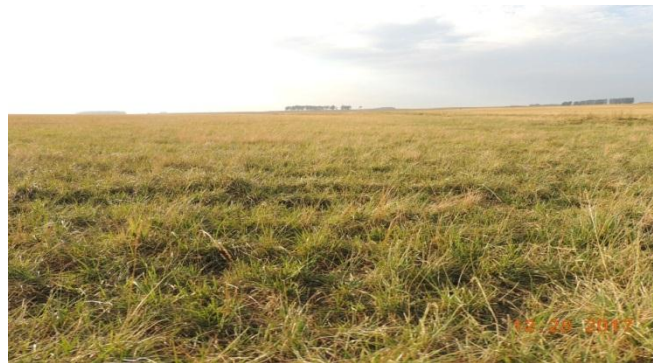
Foto 3. Pradera con raigrás y lotus