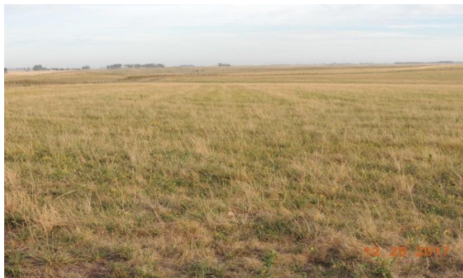
Foto 1. Pradera de raigrás, lotus, trébol blanco

Las siembras fueron realizadas en el otoño del 2017. Los animales ingresaron en agosto del mismo año.