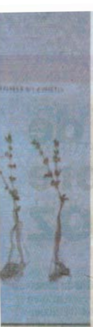
Plantas de Lotus subbiflorus inoculadas y no inoculadas