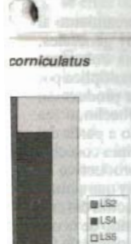
la capacidad de relación a los nitrógeno mineral.